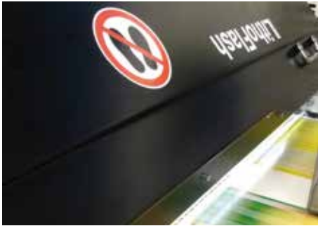
LithoFlash in einer Rollendruckmaschine