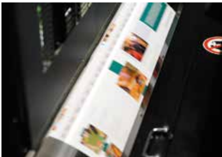
LithoFlash in einer Bogendruckmaschine