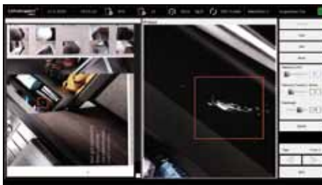
Im Lieferumfang enthaltene Bildvergleichssoftware