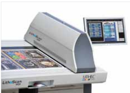
LithoScan PDF mit universalem Sensorträger